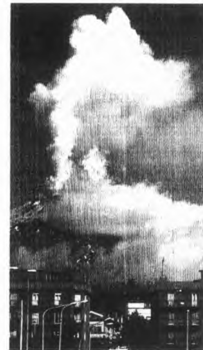
A huge cloud of smoke from Mt. Etna rises into the blue sky behind a residential area of Catania, Sicily.

i centri abitati At various times in the recent past, Nicolosi, Zafferana Etnea, Linguaglossa, and other nearby towns have been threatened by lava flows.